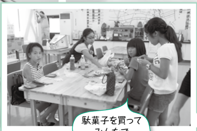
駄菓子を買って みんなで おしゃべり!